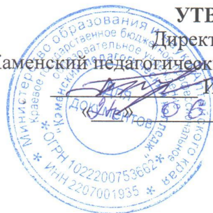
График лабораторно-экзаменационных сессий групп заочной формы обучения на 2024-2025 учебный год