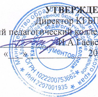
График лабораторно-экзаменационных сессий групп заочной формы обучения на 2023-2024 учебный год